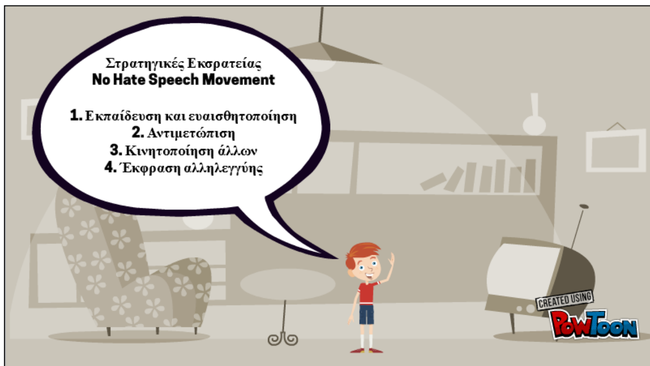
Εικόνα 5: Στρατηγικές Εκστρατείας "No Hate Speech Movement"