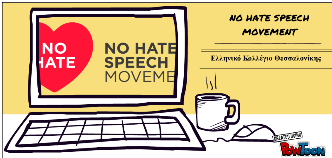
Εικόνα 1: Εισαγωγική οθόνη βιντεοπαρουσίασης

Οι πρώτες διαφάνειες επεξηγούν τη ρητορική μίσους και τους λόγους που θα πρέπει να αντιμετωπίζεται στο Διαδίκτυο με δραστικό τρόπο. Ο όρος αυτός ερμηνεύεται με τρόπο που καλύπτει κάθε μορφή έκφρασης που διαδίδει, προωθεί ή δικαιολογεί το φυλετικό μίσος και οποιαδήποτε μορφή μίσους βασίζεται στη μισαλλοδοξία, όπως: μισαλλοδοξία που εκφράζεται μέσα από επιθετικό εθνικισμό και εθνοκεντρισμό, διάκριση και εχθρική κατά μειονοτήτων, μεταναστών και ανθρώπων μεταναστευτικής καταγωγής. Ο ορισμός της ρητορικής μίσους από το Συμβούλιο της Ευρώπης προβλέπει “κάθε μορφή έκφρασης” και κάθε είδος δραστηριότητας στο Διαδίκτυο. Επομένως, το κυβερνομίσος είναι ρητορική μίσους. Ο ορισμός της ρητορικής μίσους φαίνεται στην Εικόνα 2. Στις επόμενες διαφάνειες επεξηγείται, γιατί η ρητορική μίσους είναι ένα σοβαρό πρόβλημα, αφού μπορεί να αποτελέσει παραβίαση των ανθρωπίνων δικαιωμάτων. Για να γίνει η εξιστόρηση αυτής της επιχειρηματολογίας, οι μαθητές επέλεξαν για τη βιντεοπαρουσίαση τους δυο χαρακτήρες, δυο παιδιά, ένα αγόρι και ένα κορίτσι που εμφανίζονται σε διάφορα περιβάλλοντα στις διαφάνειες (βλ. Εικόνα 3).