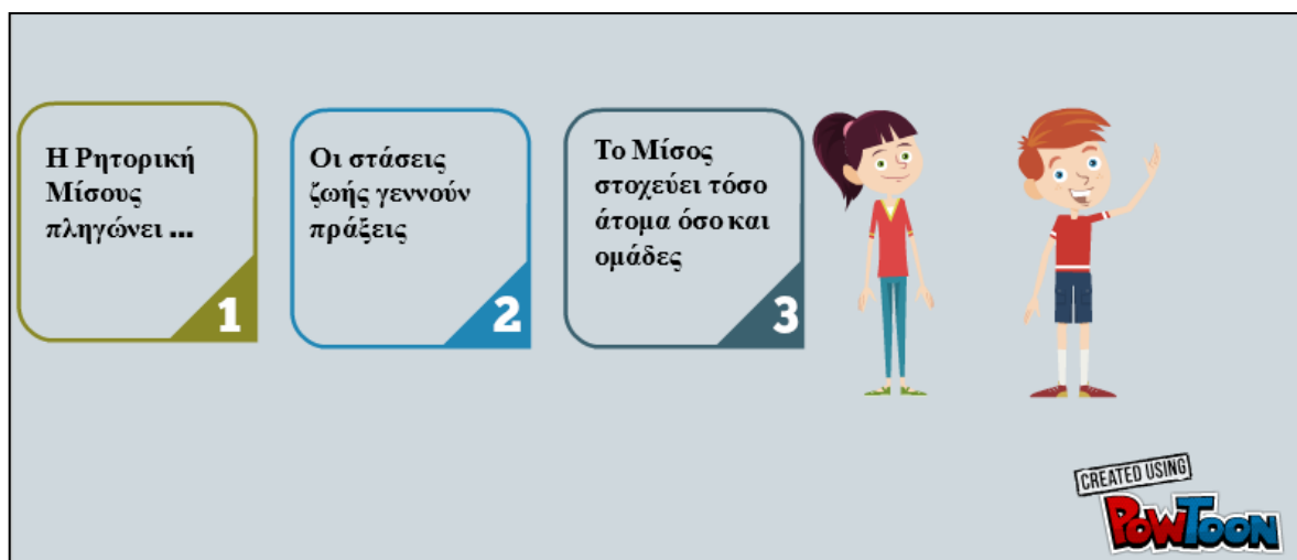
Εικόνα 3: Γιατί πρέπει να αντιμετωπίζεται η Ρητορική Μίσους στο Διαδίκτυο;

Πάνω από όλα οι μαθητές εστίασαν στις στρατηγικές εκστρατείας του Συμβουλίου της Ευρώπης, για να αρθούν όλες οι αρνητικές επιδράσεις που περιγράφηκαν παραπάνω με την ενεργή εμπλοκή όσο γίνεται περισσότερων νέων. Οι δράσεις που προτείνονται μέσα από το “No Hate Speech Movement” κίνημα είναι αρκετές και κινούνται σε τέσσερις άξονες, όπως φαίνεται στην Εικόνα 5. Η εκπαίδευση και ευαισθητοποίηση του κοινού των δικτυακών τόπων, π.χ.: μέσα από ιστολόγια (blogs) και τόπων κοινωνικής δικτύωσης που στόχο έχουν την ενημέρωση και την επικοινωνία τι μπορούν να κάνουν οι άνθρωποι που γίνονται μάρτυρες στάσεων που σχετίζονται με τη Ρητορική Μίσους. Ο επόμενος άξονας αφορά την αντιμετώπιση της προκατάληψης που ήδη υπάρχει και ανθίζει σε δικτυακούς τόπους στο Διαδίκτυο. Μια ανάλογη δράση μπορεί να είναι η αναφορά παραδειγμάτων Ρητορικής Μίσους σε οργανώσεις που ασχολούνται με το πρόβλημα ή στο Παρατηρητήριο Ρητορικής Μίσους (Hate Speech Watch). Ο τρίτος άξονας αφορά την κινητοποίηση άλλων χρηστών να καταδικάζουν ή να αναφέρουν τη Ρητορική Μίσους και να αναλαμβάνουν ανάλογες δράσεις, ενώ ο τέταρτος άξονας βασίζεται στην υποστήριξη ή έκφραση αλληλεγγύης προς θύματα ή συνήθεις ομάδες – στόχους. Όλες αυτές οι στρατηγικές